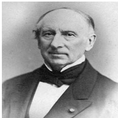
A.-L. Cauchy (1789-1857)

En 1833, William Rowan Hamilton (Inglaterra 1805-1865) da la primera definición algebraica rigurosa de los complejos como pares de números reales.