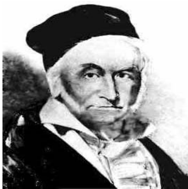
C. F. Gauss (1777-1856)

Incluso en gran Carl Friedrich Gauss (Alemania, 1777-1856), en cuya tesis doctoral (1797) se daba la primera prueba correcta del teorema fundamental del álgebra, apuntó a finales de 1825 que "la verdad metafísica de \sqrt{-1} es elusiva".