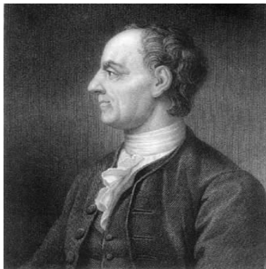
L. Euler (1707-1783)

Los números complejos fueron usados por Johann Lambert en proyecciones, por Jean D'Alembert en hidrodinámica y por Euler, D'Alembert y Joseph-Louis Lagrange en pruebas erróneas del teorema fundamental del álgebra. Euler fué el primero en usar la notación i = \sqrt{-1} , haciendo además un uso fundamental de los números complejos al relacionar la exponencial con las funciones trigonométricas por la expresión e^{ix} = \cos x + i \sen x . Euler se expresaba en los siguiente términos: