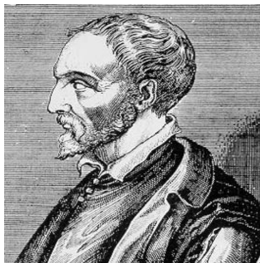
J. Cardan (1501 - 1576)

En 1545, Jerome Cardan (Italia, 1501-1576), un matemático, físico y filósofo italiano, publica " Ars Magna " (El Gran Arte) en el cual describe un método para resolver ecuaciones algebraicas de grado tres y cuatro. Esta obra se convertía así en el mayor tratado de álgebra desde los Babilónicos, 3000 años antes, que dedujeron cómo resolver la ecuación cuadrática.